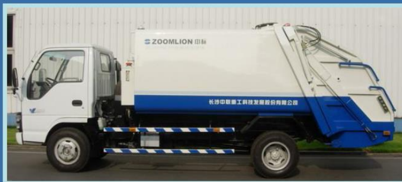
13) ZLJ5070ZYS压缩式垃圾车 图13