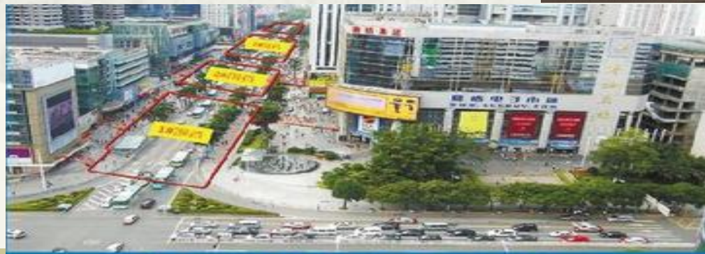
华强北片区围挡与建筑物位置关系实景图