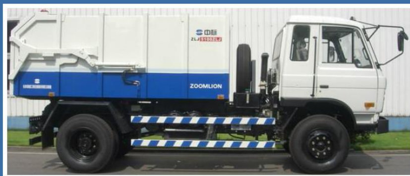
19) ZLJ5100ZLJ垃圾转运车 图19